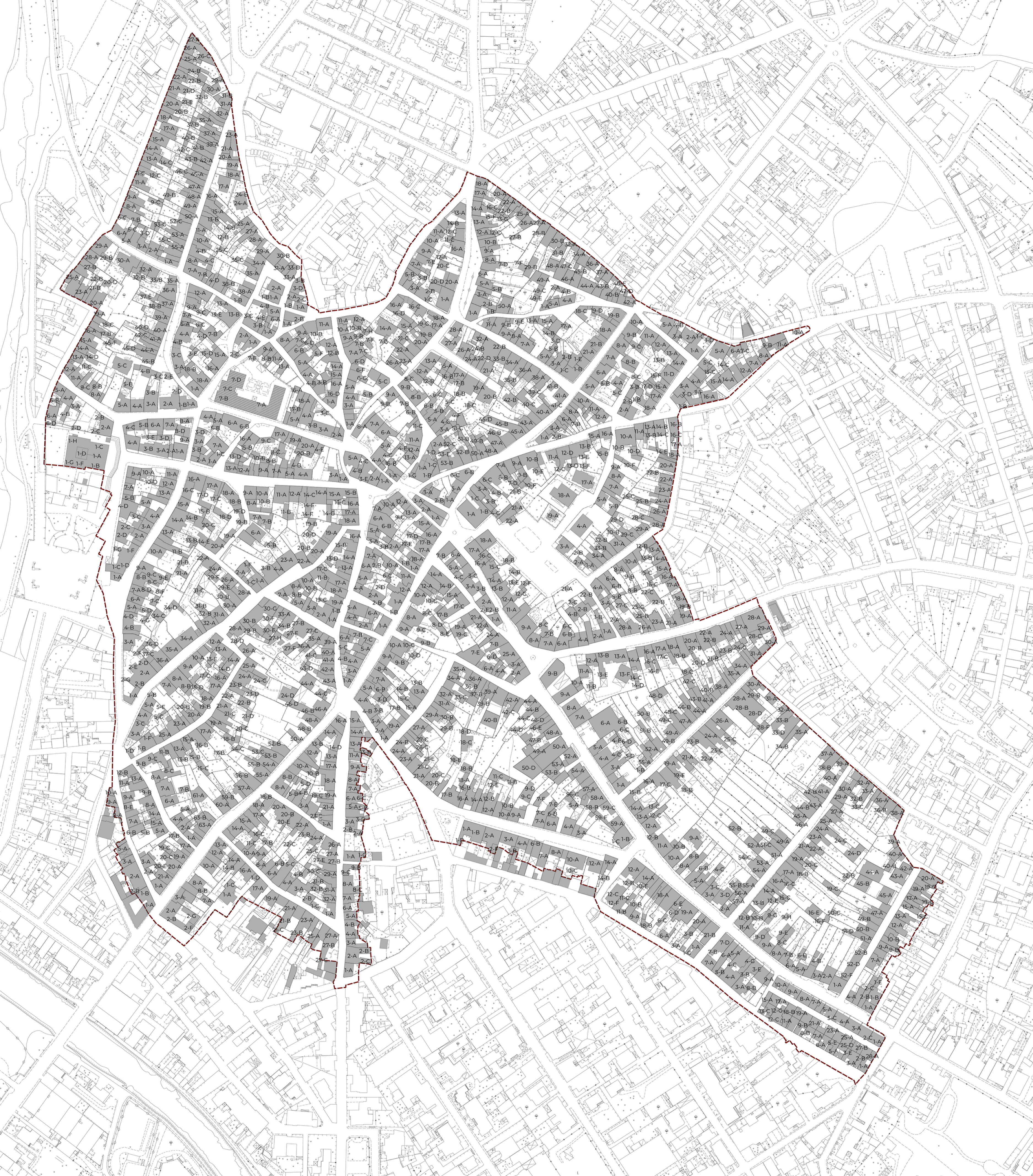
INDICAZIONE UNITÀ EDILIZIE E COMPONENTI ELEMENTARI CABRAS - SCALA 1:2.000