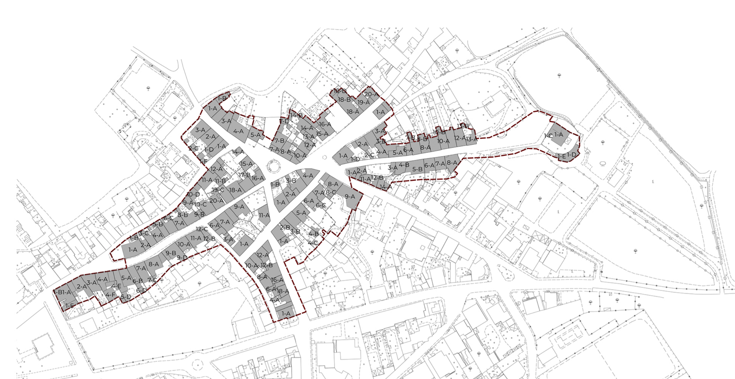
INDICAZIONE UNITÀ EDILIZIE E COMPONENTI ELEMENTARI SOLANAS- SCALA 1:2.000