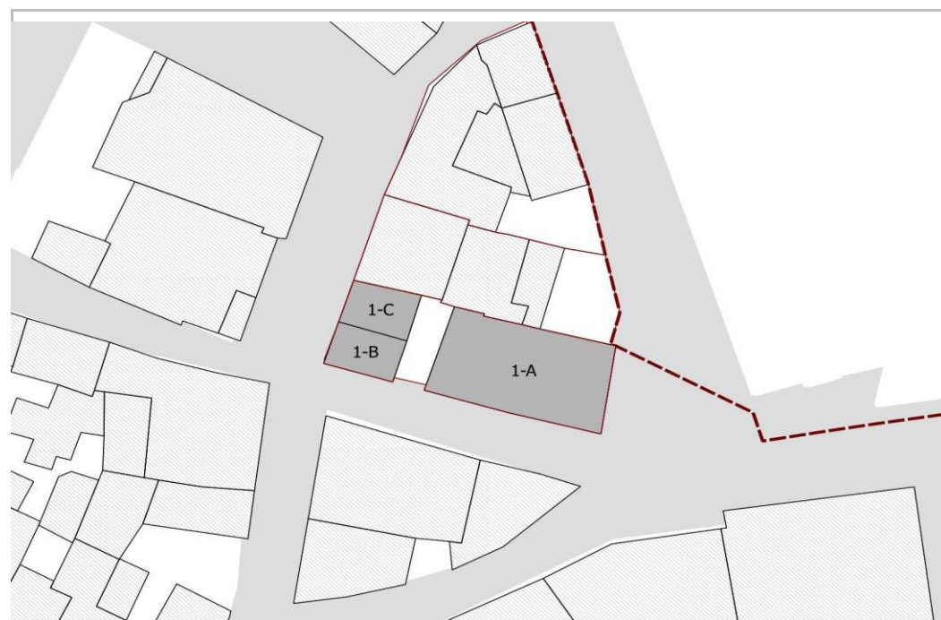
PLANIMETRIA UNITA' EDILIZIA