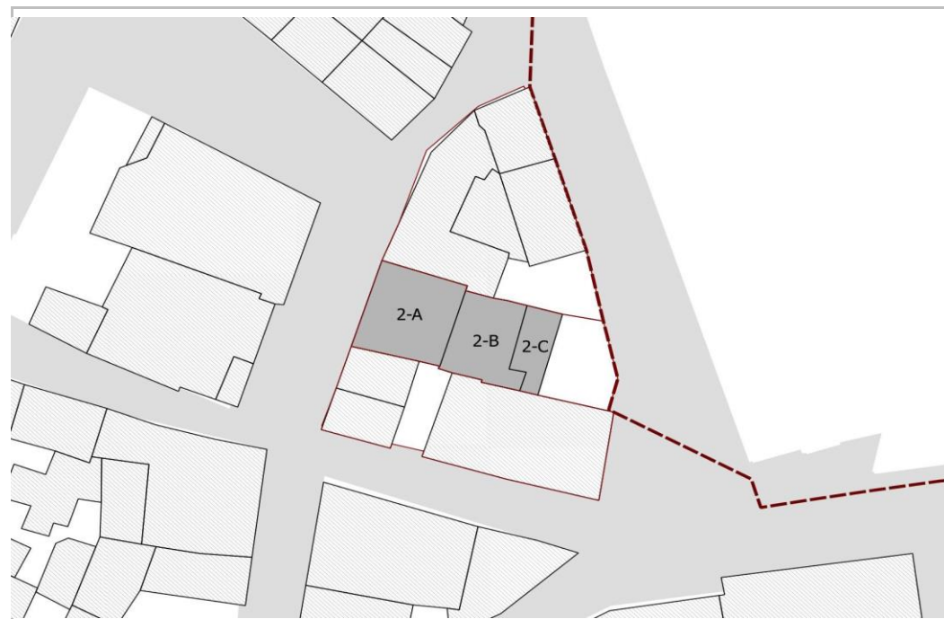
PLANIMETRIA UNITA' EDILIZIA