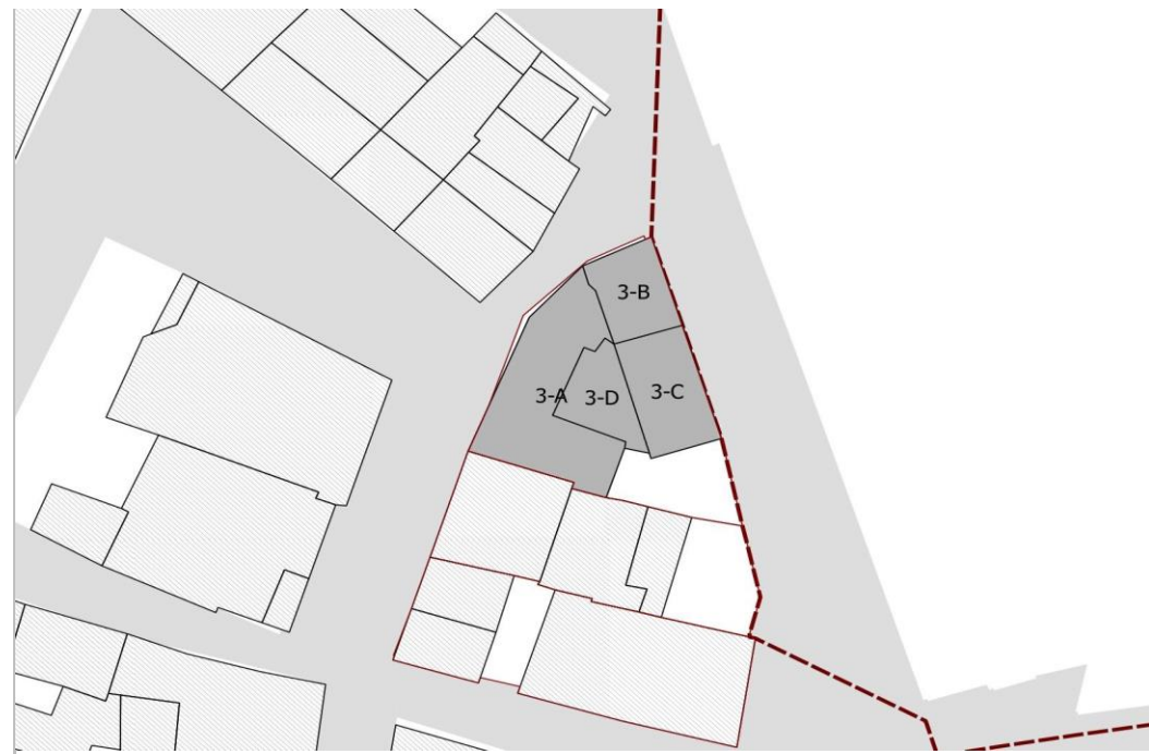
PLANIMETRIA UNITA' EDILIZIA